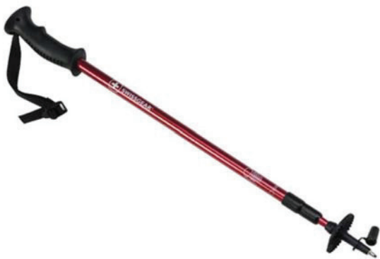
Figure 13-3-1 Bâton de ski

Wintergoodies.com. 2007. Hiking, Trekking & Walking Pole Adjustable. Extrait le 12 avril 2007 du site http://www.winterbrookgoodies.com/pd_swissgear_hiking_trekking_walking_pole.cfm