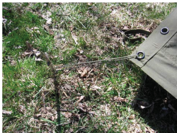
D Cad 3, 2006, Ottawa ON, Ministère de la Défense nationale