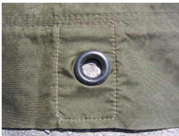
D Cad 3, 2006, Ottawa ON, Ministère de la Défense nationale