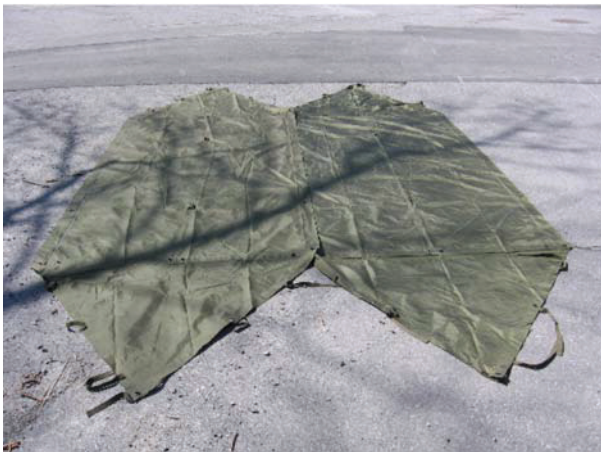
D Cad 3, 2006, Ottawa ON, Ministère de la Défense nationale

Attacher chaque extrémité des tapis de sol attachés ensemble avec la fermeture à glissière aux deux arbres en passant la ficelle par les œillets qui se trouvent à chaque extrémité de la fermeture à glissières. On doit utiliser une demi-clef à capeler ou un demi-nœud qui est fiable et qui donne de la stabilité. Il faut attacher l'abri aussi haut que la taille de l'occupant le plus grand. S'il est attaché aux bons œillets, le rabat, situé par-dessus la fermeture à glissières, s'étendra naturellement pour couvrir la fermeture à glissières.