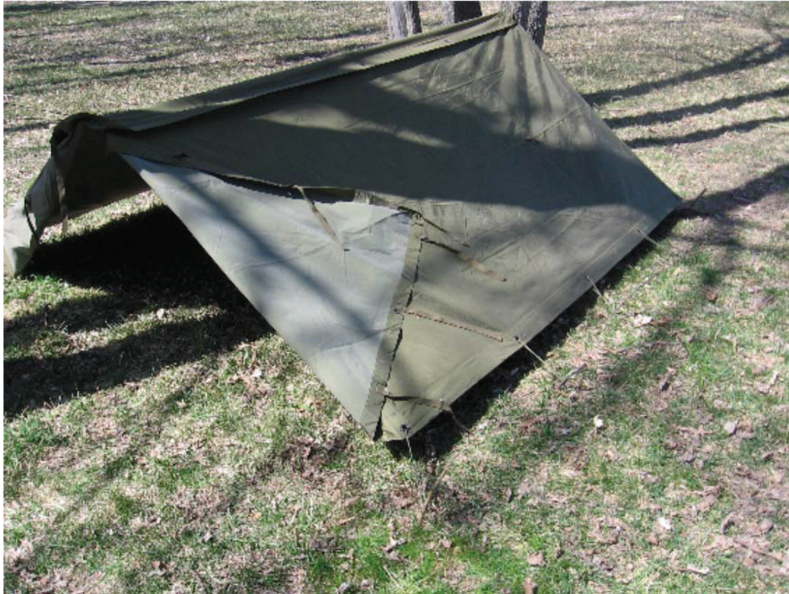
D Cad 3, 2006, Ottawa ON, Ministère de la Défense nationale