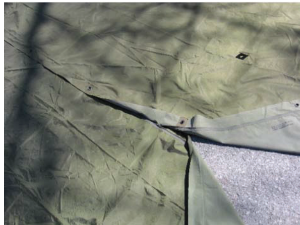
D Cad 3, 2006, Ottawa ON, Ministère de la Défense nationale