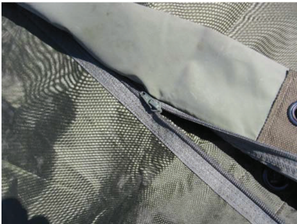
D Cad 3, 2006, Ottawa ON, Ministère de la Défense nationale