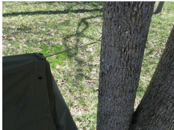
D Cad 3, 2006, Ottawa ON, Ministère de la Défense nationale