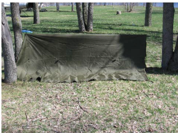
D Cad 3, 2006, Ottawa ON, Ministère de la Défense nationale