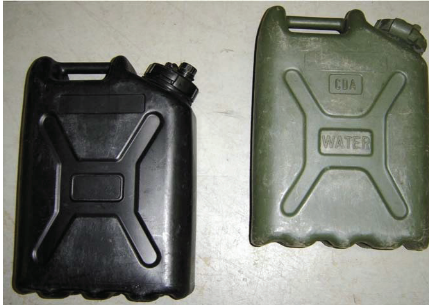
D Cad 3, 2007, Ottawa, ON, Ministère de la Défense nationale