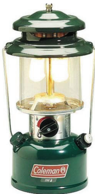
Coleman Outdoor Company. Extrait le 28 mars 2007 du site http://www.coleman.com/coleman/colemancom/detail.asp?product_id=288B700&categoryid=1015