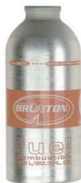
Figure 11-2-14 Récepteur de carburant

Mountain Equipment Coop. Extrait le 28 mars 2007 du site http://www.mec.ca/Products/product_detail.jsp?FOLDER%3C%3Efolder_id=2534374302696497&PRODUCT%3C%3Eprd_id=845524442413091&bmUID=1175621430159