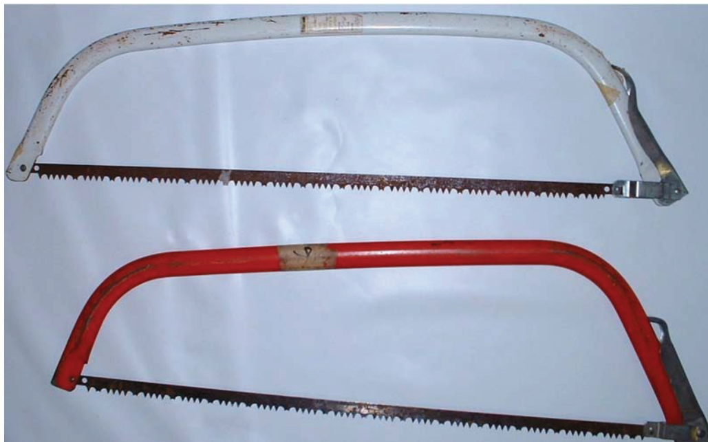
D Cad 3, 2007, Ottawa, ON, Ministère de la Défense nationale