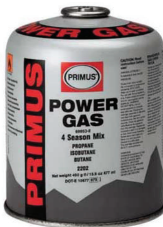
Figure 11-2-2 Gaz comprimé

Mountain Equipment Coop. Extrait le 24 avril 2007 du site http://www.mec.ca/Products/product_detail.jsp?PRODUCT%3C%3Eprd_id=845524441775741&FOLDER%3C%3Efolder_id=2534374302696497&bmUID=1178201628346