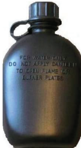
D Cad 3, 2007, Ottawa, ON, Ministère de la Défense nationale

Bouteille d'eau. On peut utiliser une bouteille d'eau pour tout type de randonnée pédestre. L'équipement polyvalent est avantageux pour l'utilisateur. Choisir les bouteilles qui peuvent supporter les températures de liquides froids à congélation ou chauds à ébullition.