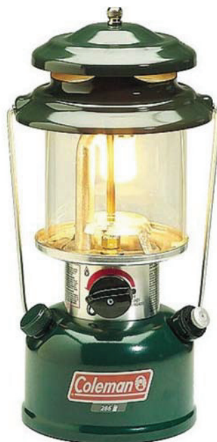
Coleman Outdoor Company. Extrait le 28 mars 2007 du site http://www.coleman.com/coleman/colemancom/detail.asp?product_id=288B700&categoryid=1015