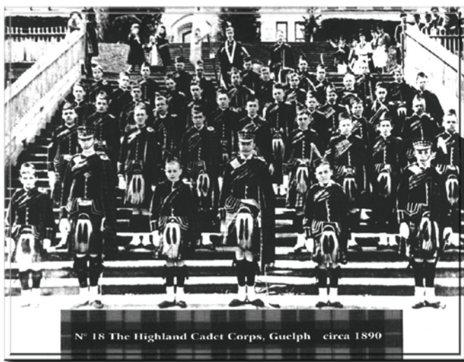
A-CR-CCP-121/PT-001 (p. 2-20)

La distinction entre les cadets d'école secondaire et les miliciens adultes est devenue évidente en 1879 lorsque l'Ordre général de la milice 18 autorisait la formation de 74 « associations d'exercice militaire dans les institutions d'enseignement » pour les jeunes hommes âgés de plus de 14 ans qui ne devaient « sous aucun prétexte être employés dans le service actif ». Les cadets fournissaient leurs propres uniformes. Les cadets, dans la photo ci-dessous, ont importé leurs uniformes de l'Écosse à des coûts si élevés que seulement un jeune par famille pouvait faire partie du mouvement.