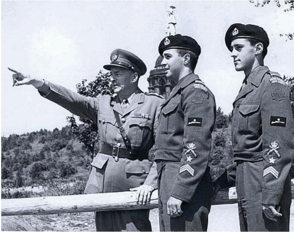
Ligue des cadets de l'Armée du Canada. 2007. Comité de l'histoire et de l'héritage, Attributs, Insignes d'épaule, Insignes de coiffure et Uniformes. Extrait le 23 avril 2007 du site http://www.armycadethistory.com/Uniforms.htm