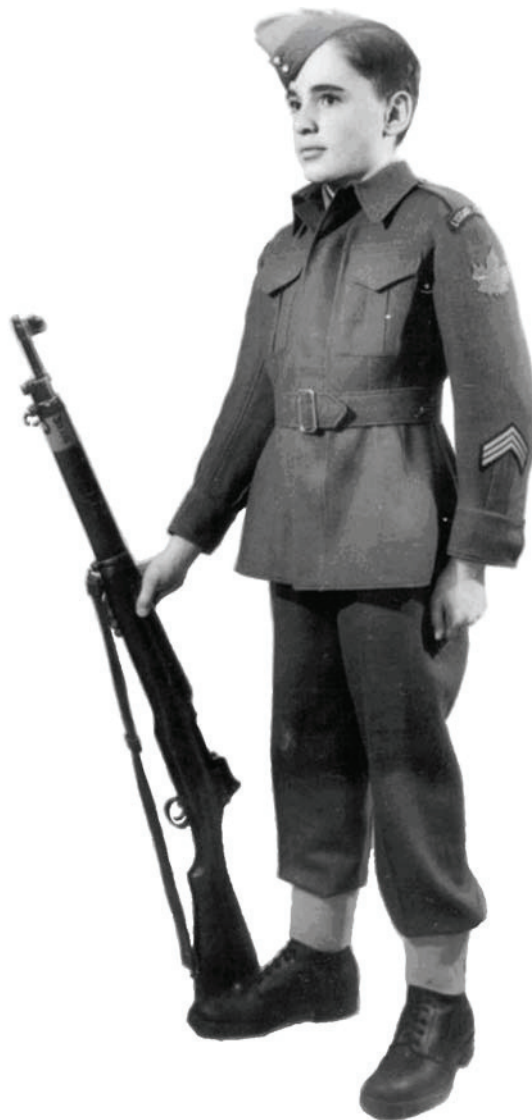
Ligue des cadets de l'Armée du Canada. 2007. Comité de l'histoire et de l'héritage, Attributs, Insignes d'épaule, Insignes de coiffure et Uniformes. Extrait le 23 avril 2007 du site http://www.armycadethistory.com/Uniforms.htm