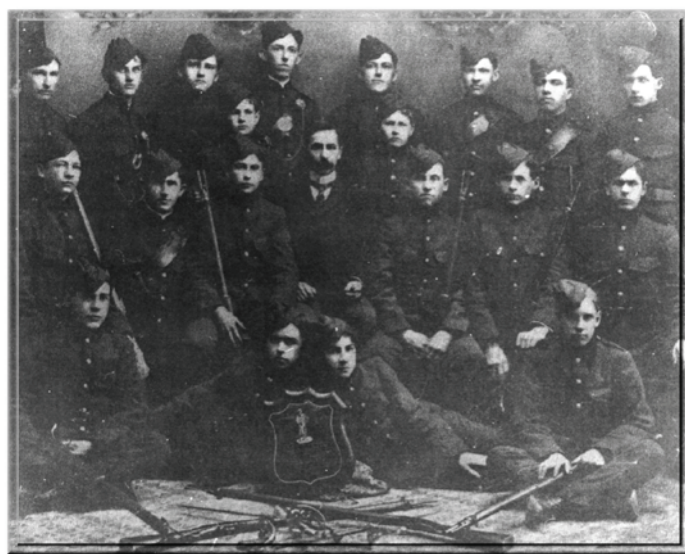
#10 MOUNT FOREST HIGH SCHOOL CADET CORPS - 1902

Le terme « corps des cadets » apparaît pour la première fois en Ontario en 1898, en même temps qu'une disposition concernant les instructeurs de corps de cadets qui seraient membres du personnel enseignant de l'école plutôt qu'un instructeur appartenant à l'unité de la milice locale. Les Ordres généraux de la milice numéros 60 et 61, de 1899, autorisaient pour la première fois les corps de cadets d'être attachés aux unités de la milice, limitant l'adhésion aux jeunes hommes âgés de 14 à 19 ans.