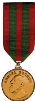
« La médaille de la Fondation Lord Strathcona ». 2007. Ligue des cadets de l'Armée du Canada (Ontario). Extrait le 16 avril 2007 du site http://www.cyberbeach.net/army/badges/lordst~1.jpg