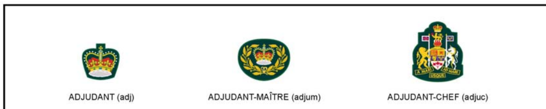
Figure 7-2-2 Grades des cadets et militaires du rang : adj – adjum – adjuc

Ces grades sont portés au bas de la manche du bras droit sur la veste d'uniforme du cadet.