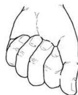
Figure 8-1-1 Position garde-à-vous

A-PD-201-000/PT-000 Manuel de l'exercice et du cérémonial des Forces canadiennes, 2001