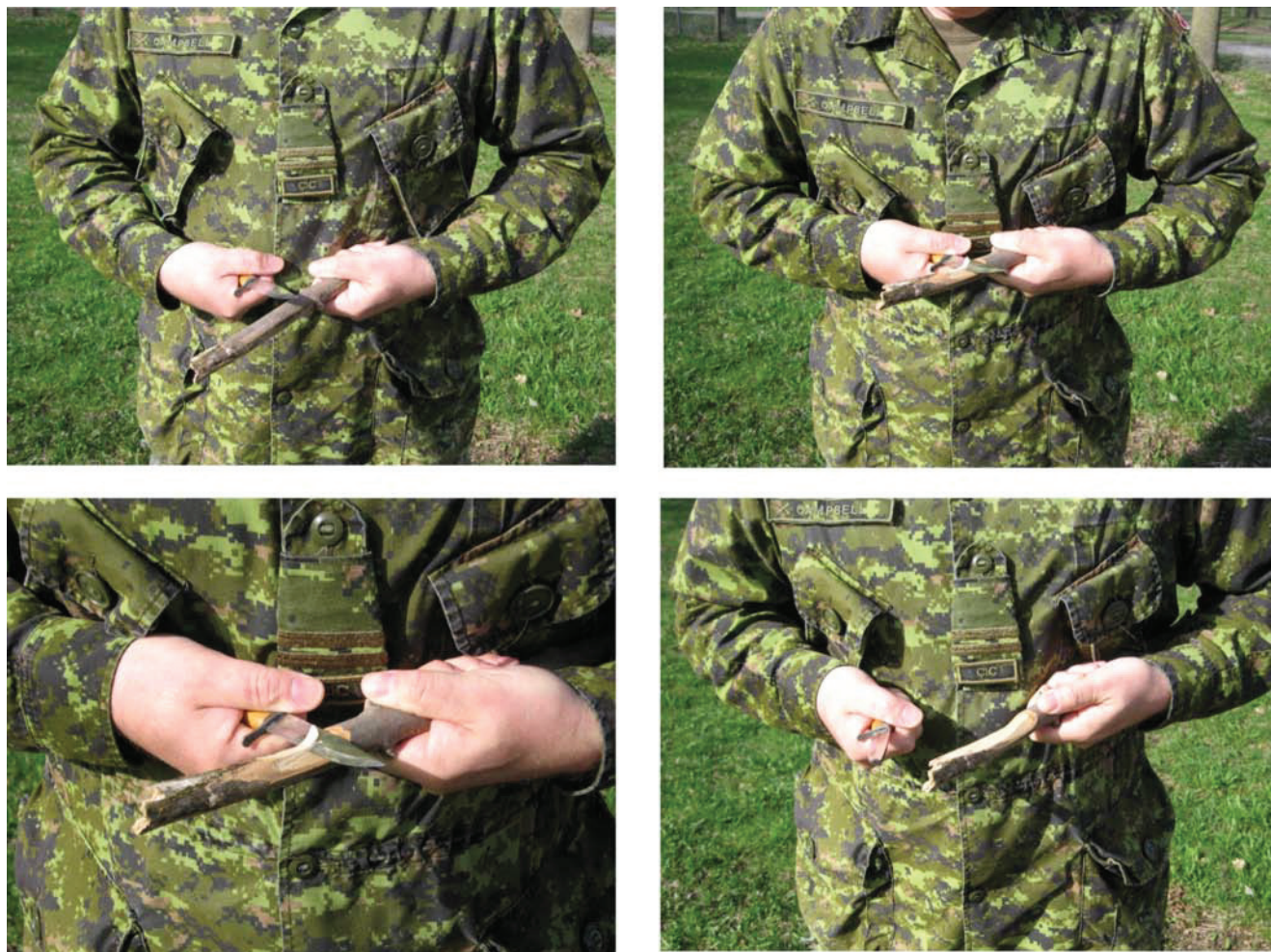
Figure 4 Traction épaule et grand dorsal

Nota. Créé par le Directeur - Cadets 3, 2009, Ottawa, Ontario, Ministère de la Défense nationale.