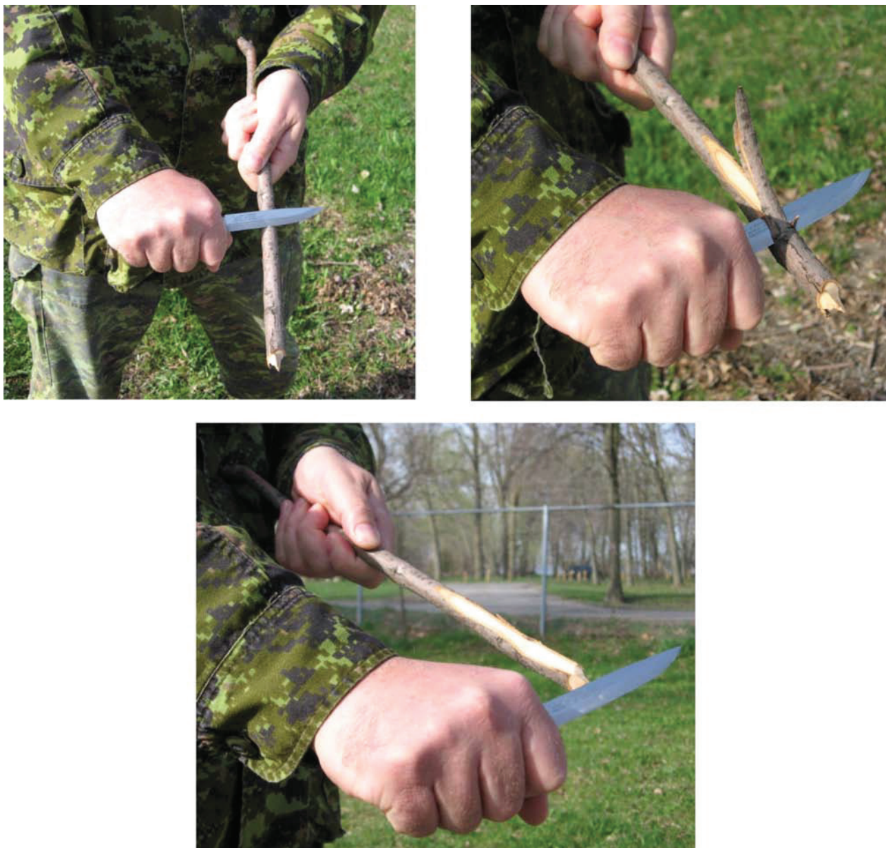
Figure 1 Coupe en ligne droite

Nota. Créé par le Directeur - Cadets 3, 2009, Ottawa, Ontario, Ministère de la Défense nationale.