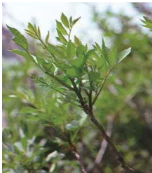
Figure 12-3-6 Sumac vénéneux

Agriculture et Agroalimentaire Canada. Extrait le 18 mars 2008 du site http://res2.agr.gc.ca/ecorc/poison/vernix_e.htm