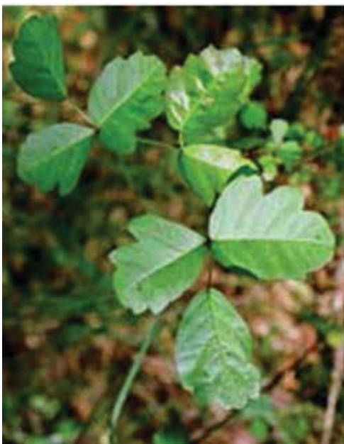
The Coloma Valley: Where the Gold Rush Began: Coloma Valley Nature Reference. Extrait le 18 mars 2008 du site www.coloma.com/reference/401-1-18-poisonoak.jpg